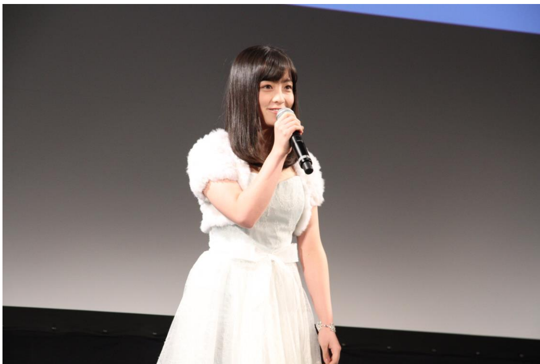
『セーラー服と機関銃 -卒業-』 主演：橋本環奈さん