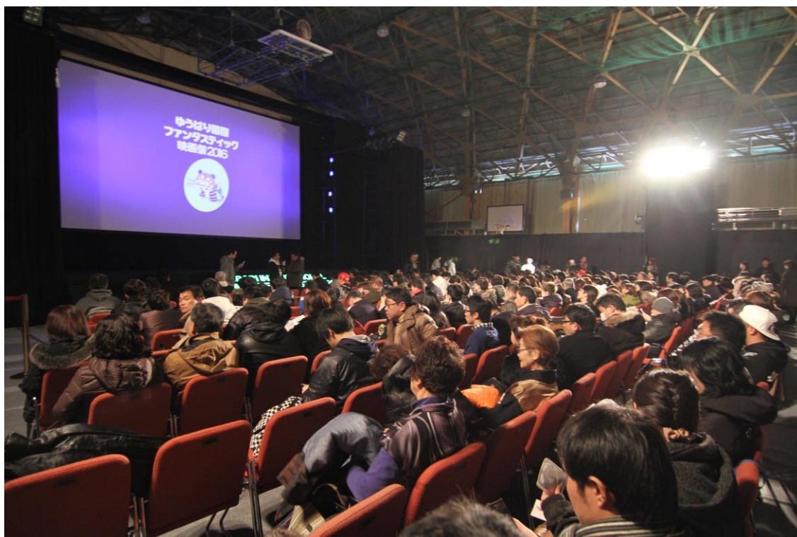
⑫ クロージングセレモニー