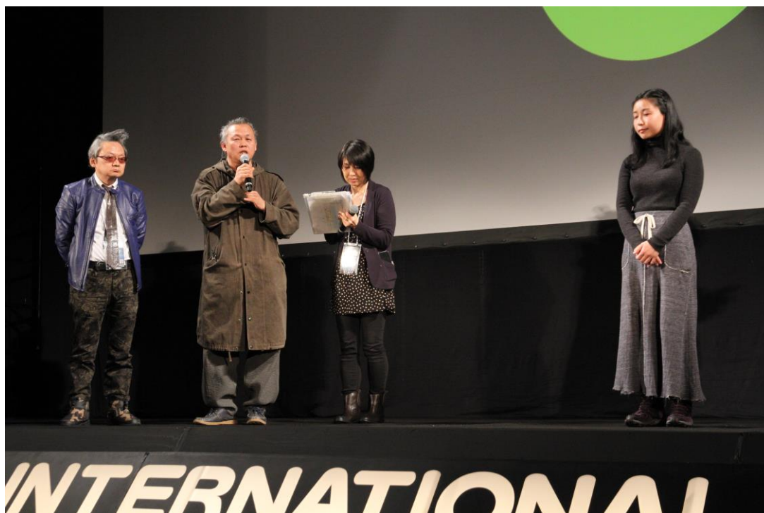
『STOP』 キム・ギドク監督